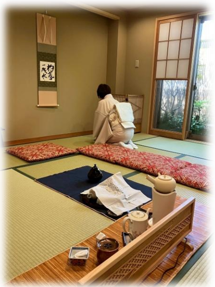
茶事「杓底一残水」 主催 叡智庵