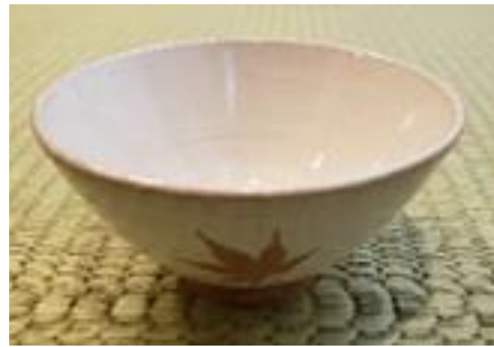
宮島御砂焼 もみじ紋 山根対蔵堂