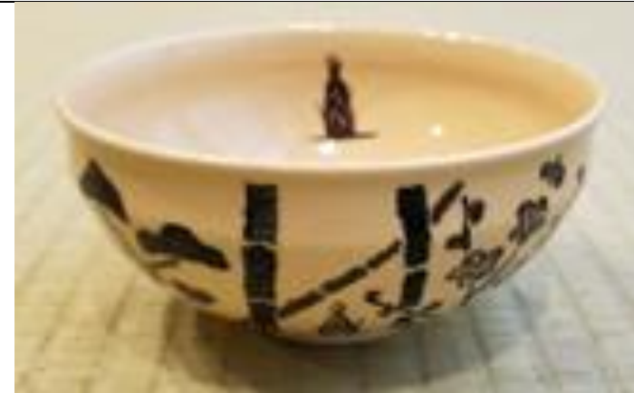
栗田焼 松竹梅 秀昭絵付