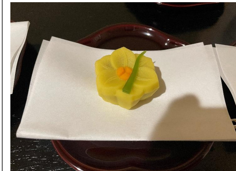
煉切 銘 水仙