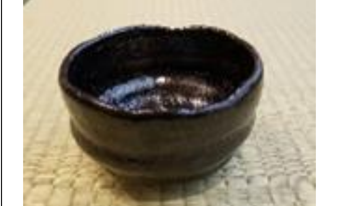
楽茶碗 工房真楽 鬼窪真史作