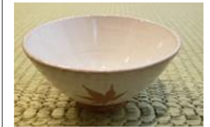
宮島御砂焼 もみじ紋 山根対蔵堂