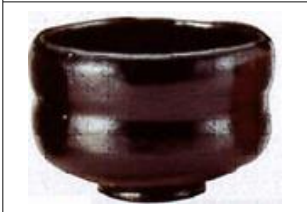
黒楽 鉢閑 利休七種茶碗 長次郎写し 佐々木昭樂作