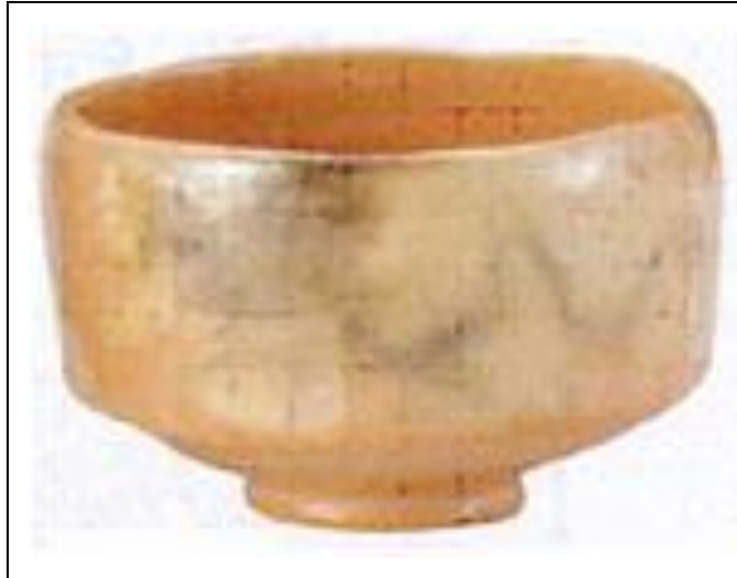
赤楽 早舟 利休七種茶碗 長次郎写し 佐々木昭楽作