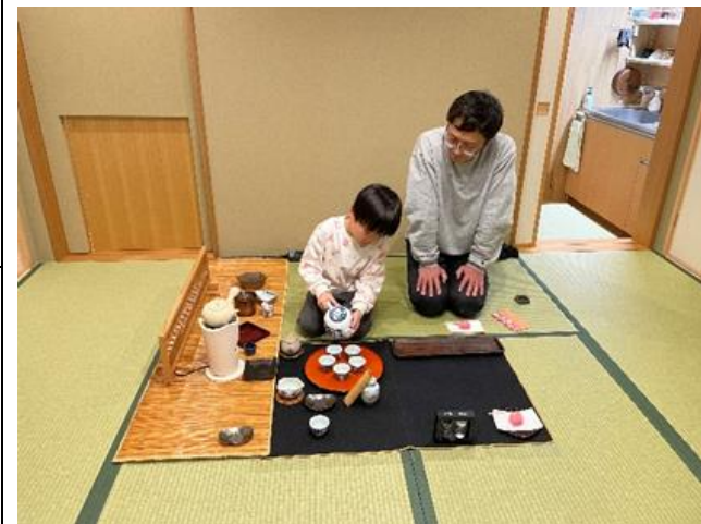
教室稽古風景(亥の子餅、寒椿、ベル、梅)