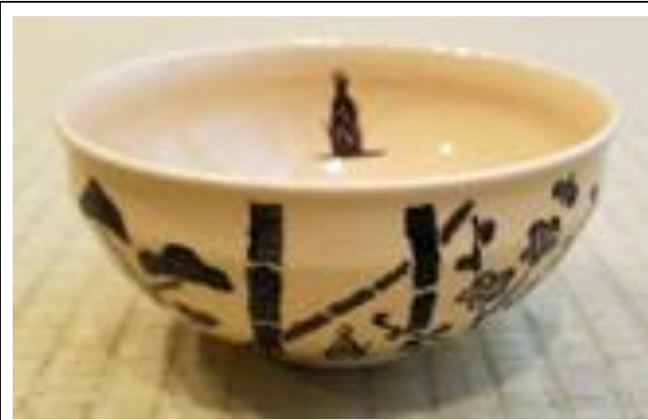
栗田焼 松竹梅 秀昭絵付