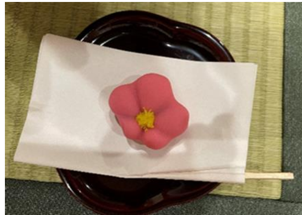
煉切 銘 梅