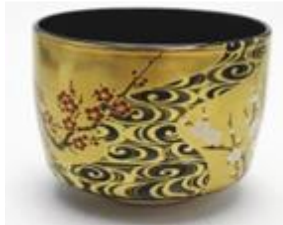
筒茶碗 光琳梅 紅梅・白梅 宮地英香作