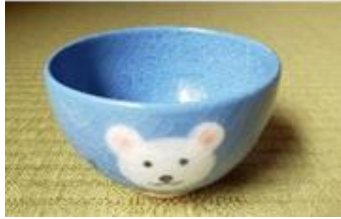
野点小茶碗 しろくま 紅山窯